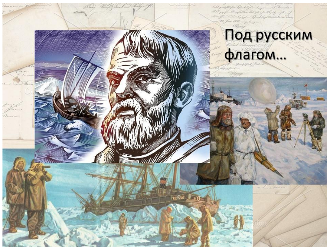
Слайд 1. Заставка мероприятия