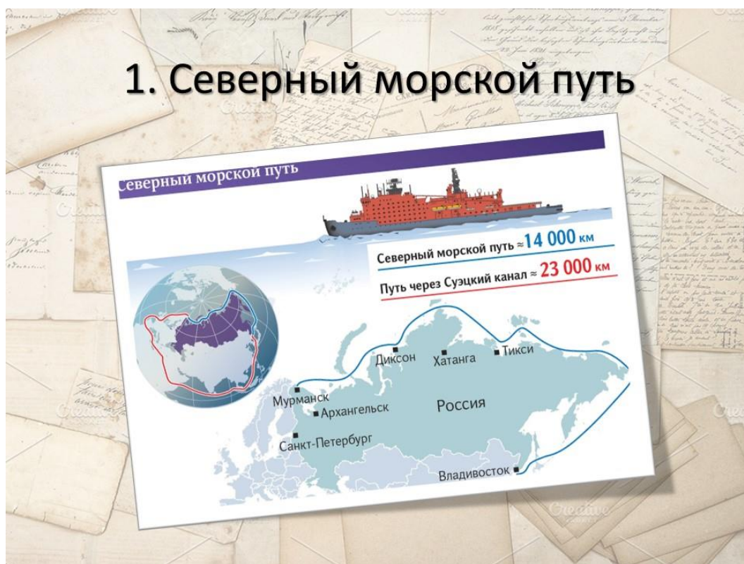
Слайд 6. Северный морской путь