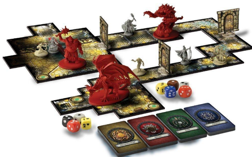
Пример америтреша – серия игр «Descent»

«Древний Ужас» – классическая игра по вселенной Говарда Филлипса Лавкрафта, повествующая о том, как группа авантюристов пытается не допустить пробуждения Великих Древних: Ктулху, Йигга и иже с ними. Персонажи путешествуют по миру, сражаются с чудовищами, ищут улики, разгадывают тайны, и всё это сопровождается проверками на кубиках – тысячи их! Сама игра построена так, чтобы закручивать спираль бед – с каждым ходом ситуация ухудшается, усложняется, и чтобы переломить игру, команда должна работать как единый организм – и удачно кидать кубики.