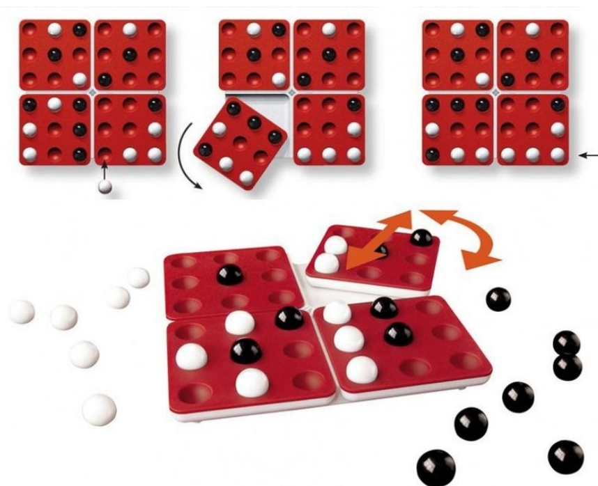
Правила игры «Пентаго» в виде схемы

К физическим абстрактным играм относятся, например, «Jungle Speed» и «Барабашка» – игры, в которых требуется хватать предметы по определённым правилам, на скорость реакции.