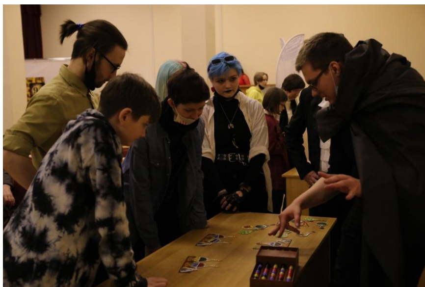
Настольные игры как элемент мероприятия – фэнтези-фестиваля «Волшебные миры»

На одной из итераций фэнтези-фестиваля «Волшебные миры», посвящённой вселенной «Гарри Поттера», настольная игра «Катамино» использовалась как тематическая площадка. Кто помнит книгу, тот знает про особую платформу 9\frac{3}{4} , с которой уходил экспресс до школы магии Хогвартс. Организаторы фестиваля оформили фотозону – подъезжающий поезд на фоне, россыпь чемоданов, один из них раскрыт – там книги серии – и поставили стол, на котором разложили игру. Чтобы победить в игре, надо было на определённой площади собрать комбинацию деревянных фигур – это были как бы разбросанные чемоданы, которые посетители помогали укладывать в тележку грузчика.