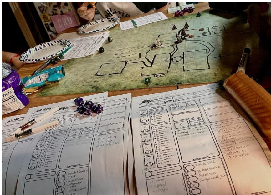
Типичный игровой стол для «Dungeons and Dragons»

В 1934 году появилась настольная игра «Монополия», созданная американцем Чарльзом Дэрроу и ставшая первой настольной игрой в жанре экономической стратегии. Уже в 1936 году она стала самой продаваемой настольной игрой в США. Что интересно, основана «Монополия» на концепте «Игр землевладельцев», игры, созданной в 1903 году и призванной продемонстрировать несправедливость системы права собственности на землю. Та игра не нашла аудиторию за пределами узкого круга студентов и интеллектуалов. Но в годы Великой Депрессии в США возможностью зарабатывать хотя бы за игрой были очарованы тысячи человек.