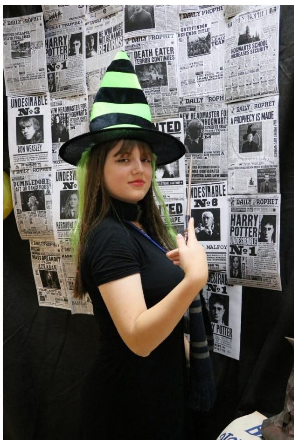
Фотозона на Дне Игр «Игрополис»-2023

Уже более десяти лет проводится День Игр «Игрополис». В 2023 году он назывался «Академия магии: практикум по чудесам» и прошёл 23 сентября. Мероприятие посетили 822 человека. Работали более 20 различных площадок. В течение всего дня проходили мастер-классы, гости могли