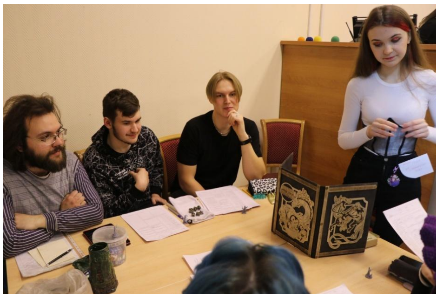
Игровой стол на фестивале «По Ту Сторону Страниц»

По итогу формат был признан интересным, но, требующим большего пространства, чем конференц-зал библиотеки.